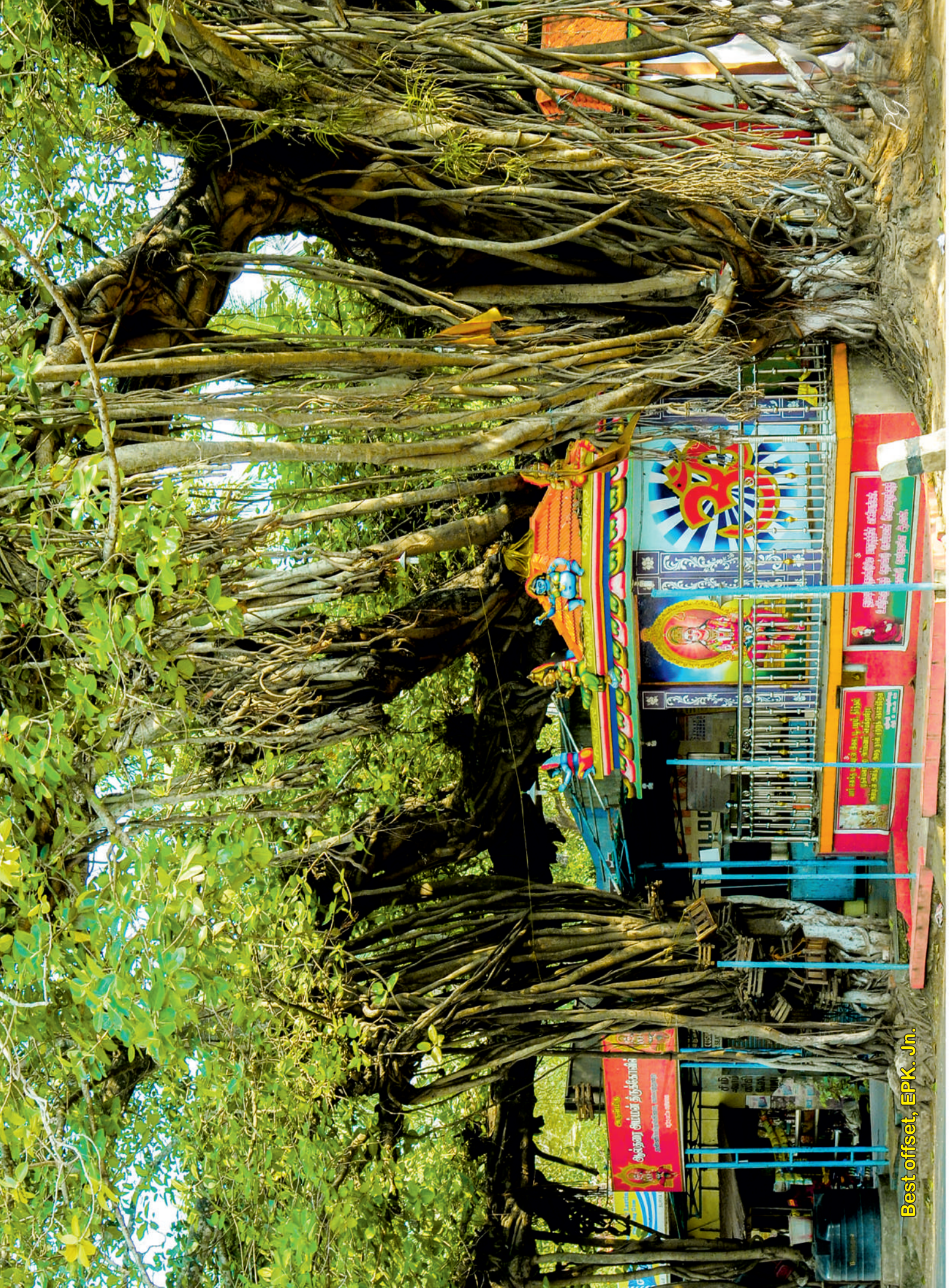
Best offset, EPK. Jn.